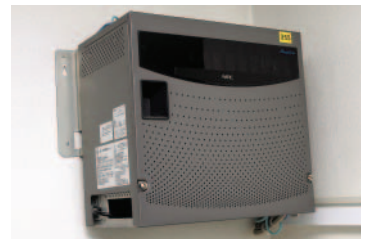
音声とデータを一つのIPネットワークに統合する「Aspire」本体。店舗間のIP内線をはじめ、ネットワークの一元管理を実現している

この課題に対しNECインフロンティアは、VoIP化による店舗間の無料通話に着目。音声とデータを統合したIPネットワーク網の構築を提案し、コストの削減をシステム全体で考えるというスケールアップの手法を説明しました。この提案は、店舗間の電話料金の削減を検討していた同社のニーズともマッチし、2004年4月、音声とデータを統合したIPネットワークの導入が決定されました。同年6月、これまでの提案力と柔軟な対応力を高く評価され、音声通話サービスにKDDI-IPフォンと「Aspire」が選ばれ、同年8月には本社と8店舗間での本格運用が開始されました。